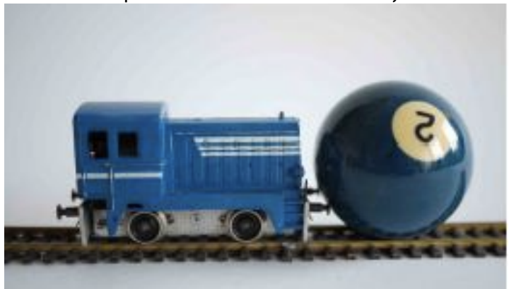
Le mouvement des particules Expérimentation à l'atelier

Ce projet n'a pas pour vocation de promouvoir la science, mais est conçu comme une approche singulière et subjective d'un artiste qui est fasciné par le réel sous toutes ses formes, même celles qui ne sont pas perceptibles par nos sens.